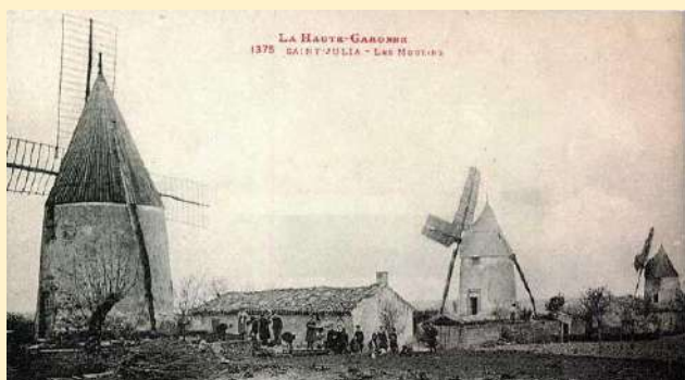
Carte postale des moulins de Saint-Julia vers 1900

Débouchant sur la place, l'avenue des Moulins (15). Ces moulins, à l'origine au nombre de quatre, étaient destinés à moudre les céréales produites aux alentours. Il semble qu'un d'eux était dédié à la production du pastel. En 1906, on comptait six meuniers qui exerçaient leur métier dans la commune. Tous ces moulins ont perdu leurs ailes. Un d'entre eux, dont l'activité a cessé entre 1930 et 1940, a été rénové en 1970.