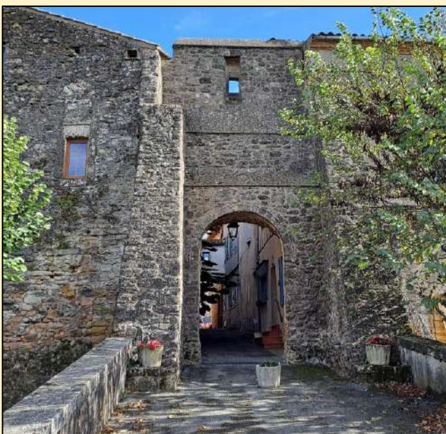
La porte de Sers

Saint Julia compta jusqu'à 1015 habitants en 1836. Aujourd'hui la population est d'environ 425 habitants. De forme circulaire, le village a conservé des vestiges de murailles du XIIe siècle et des restes de ses anciens fossés, les ruelles sont étroites, telle cette rue de la Porte-de-Sers (2).