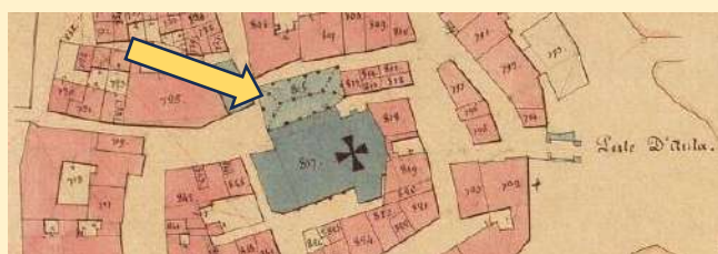
Plan cadastral de 1831

Adossée à la face nord de l'église, se trouvait une halle couverte, maintenant disparue. Elle reposait sur des piliers en bois et occupait une grande partie de la place. Sa présence n'est attestée que sur des plans d'époque.