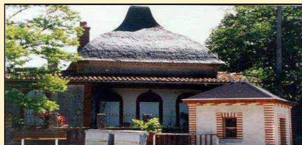
Le Pavillon des Roses

Derrière le poids public, on aperçoit le Pavillon des roses (14), cette maison à la toiture insolite date du milieu de XIX e siècle. De style Directoire, elle possède un toit en forme de chapeau de Napoléon. D'après une légende, c'était un lieu de rendez-vous galant pour les hommes de la bourgeoisie après une partie de chasse.