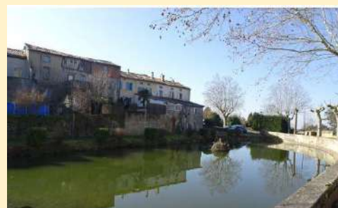
Les anciennes douves

Le tour du village s'achève sur le bord de la mare (16), qui est un reste des douves du XII e siècle. Une partie a été comblée pour en faire un parking. Au numéro 7 de la rue du Bord-de-Mare il y avait un relais de poste. Les relais ont été supprimés en 1873.