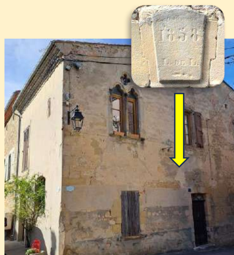
La maison « Lamy »

En face du portail d'entrée de l'église, observez la maison (4) qui fait angle. Sur sa façade donnant dans la « rue des Moulins », vous pouvez voir sur le linteau de la porte d'entrée les lettres gravées « L. DE L. ». Ce sont les initiales de Léon de Lamy 2 , maire de Saint-Julia de 1842 à 1872. Au premier étage, une fenêtre gothique géminée, aux arcs séparés par une colonne en pierre, montre le riche passé de cette demeure. Au cours du XIXe cette maison a été l'hôtel de ville ou maison commune. En 1857, elle est devenue maison d'école, avec logement pour l'instituteur. Au début du XXe siècle elle a été une épicerie.