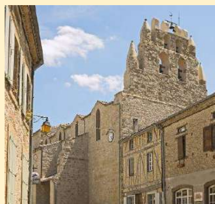
L'église avec son clocher-mur

L'église (6) de Saint-Julia, dédiée à saint Julien et sainte Agathe, contient beaucoup de richesses architecturales et de très belles œuvres d'art. De nombreux tableaux tapissent le cœur. Le clocher-mur en éventail du XIe siècle, visible de très loin, abrite cinq cloches, dont une est la plus ancienne du département (1396). La description précise de l'église fera l'objet d'une prochaine publication.