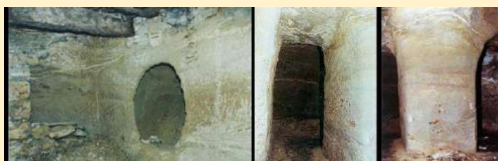
Ensemble de silos trouvés dans le sous-sol du village

Face à cette maison se trouve le bar associatif « Le Garage » (10), qui n'ouvre qu'en juillet et en août. C'était l'ancien atelier d'un charbonnier. Dans cette maison comme dans de très nombreuses maisons de Saint-Julia, on trouve des silos 3 creusés dans le sous-sol. Ces trous étaient destinés à conserver les récoltes et à les protéger des pillards. Une quarantaine de silos ont été répertoriés. Leur origine remonte à l'époque mérovingienne, du Ve au VIIe siècles. Des objets de cette époque ont d'ailleurs été trouvés dans un cimetière : ils sont exposés au musée Saint-Raymond de Toulouse.