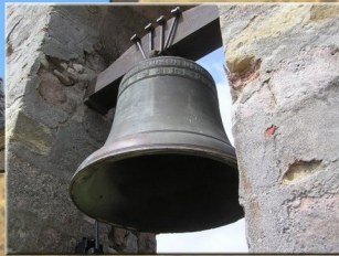
Conservatoire Monuments Historiques